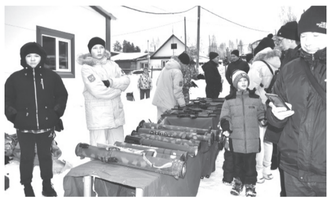
Юные воспитанники новоуральского военно-патриотического клуба «Крылатая гвардия» демонстрировали разные виды оружия.