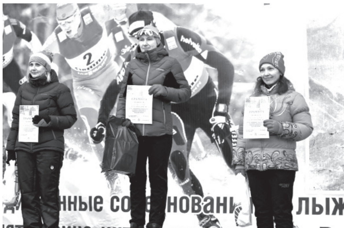
Победители женского забега лыжных гонок памяти В. Зимина. Читайте на стр.6