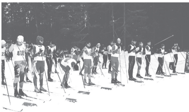
В этот день стартовали почти 500 лыжников разных возрастных категорий. Лыжники были разделены на 12 групп: самый младший участник - 2019 г.р., самый старший - 1945 г.р.