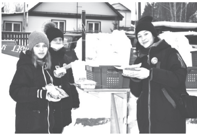
ДЮСШ им. В.Зимина выражает благодарность коллективу столовой «ЮТА» и волонтерам движения «АЗИМУТ» (на фото) за организацию питания участников гонок.