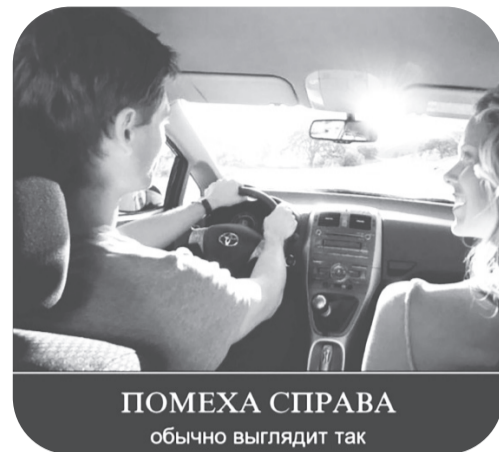
ПОМЕХА СПРАВА обычно выглядит так