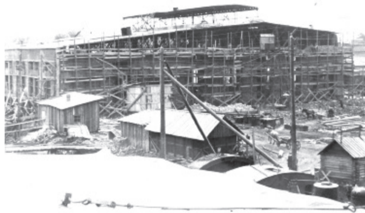
Строительство механосборочного цеха.

ния всех ресурсов: и интеллектуальных, и физических. Помню, как мы намучились с одним самомонтирующимся краном. Одна стрела у него была такой величины, что занимала всю длину цеха. Все сварные швы этого крана мы проверяли с помощью рентгеновских снимков. Когда мы делали его сборку, то не знали, всё ли будет в порядке. Я не мог отправить людей на риск, поэтому сел в кабину крана сам и запустил его монтаж: «ноги» крана стали собираться и подниматься вверх, потом встали на рельсы. Я еще покатался на нём немного, чтобы протестировать работоспособность. Всё завершилось благополучно - кран не развалился. После этого краны ГПК-5 казались нам